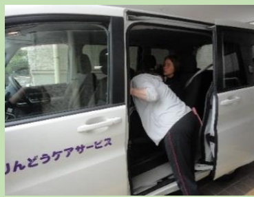
⑤ 避難誘導訓練完了 点呼と安全確認