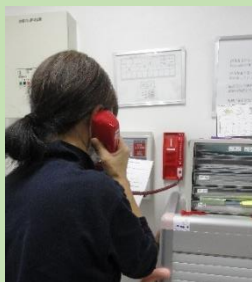
① 初期消火訓練後 119番通報訓練

10月中旬、ケアタウン大磯（1F ケアヴィレッジ・2F グループホーム）にて火災発生を想定した避難訓練を行いました。