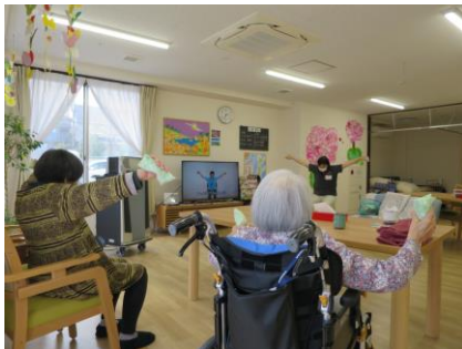
イスに座りながらできる体操だから安心!