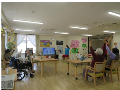
誰でもできる体操だから楽しい!